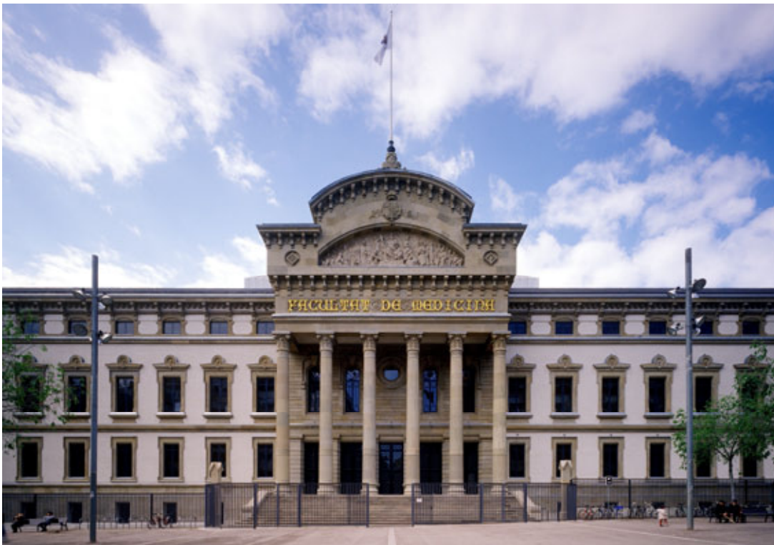
FAÇANA FACULTAT DE MEDICINA – ENTRADA PRINCIPAL CARRER CASANOVAS

ZONA: HOSPITAL CLINIC – FACULTAT DE MEDICINA - BARCELONA