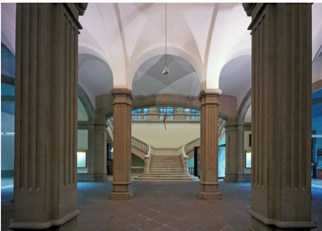
VISTA VESIBUL AMB COLUMNES – ENTRADA PRINCIPAL