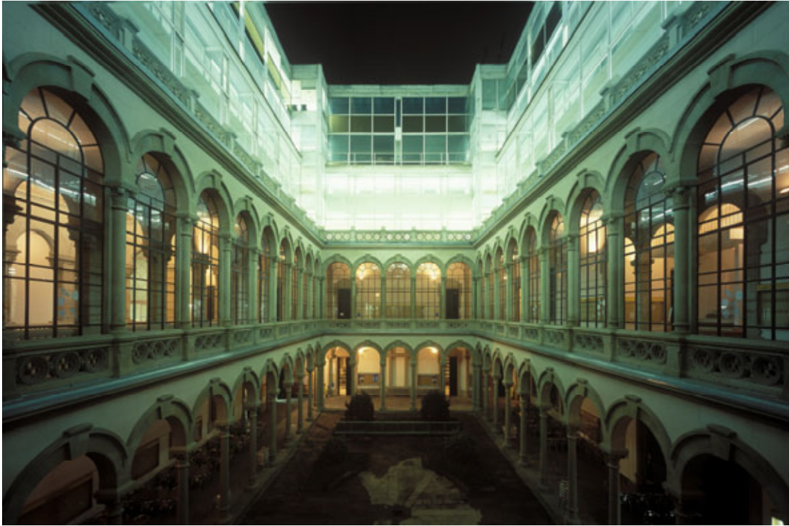
VISTA GENERAL CLAUSTRE AMB PASSADIS PRIMER PIS